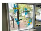
7,10班制作「体力アップを おうえんするとんぼ」