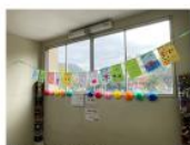
1,6,11,13班制作 「みんなをうえる旗」