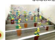
2,4班制作「幸運をひきよせる風車の花」