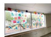
8,18班制作「ハッピーになれる 折り紙のかざり」