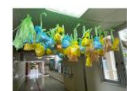
12,17班制作「願いをかなえる美」